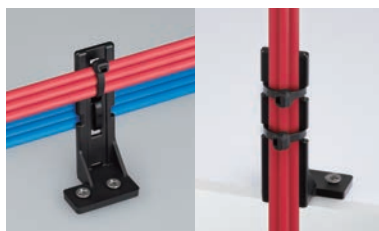
横配線、縦配線どちらでも固定できます。