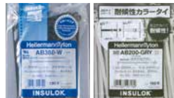
ABシリーズ耐候グレード(黒色写真左)との違いが一目でわかる専用パッケージ入り(写真右)。