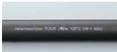
チューブ表面にシリーズ名「TCN20」とULの温度定格・電圧定格及び難燃グレードの表示があります。

薄肉で柔軟性に優れた、難燃性ポリオレフィン製です。環境性に優れ、特定臭素系難燃剤 (PBB、PBBO、PBBEなど) を含有していません。また、難燃性UL224、鉄道車両用材料燃焼試験に適合しており、機器内配線の結束・保護、電線の接続端子や端末処理の絶縁・保護に最適です。優れたコストパフォーマンスと汎用性で、電気・通信・電子機器、産業機械、鉄道・輸送機器など幅広い分野でご使用いただけます。